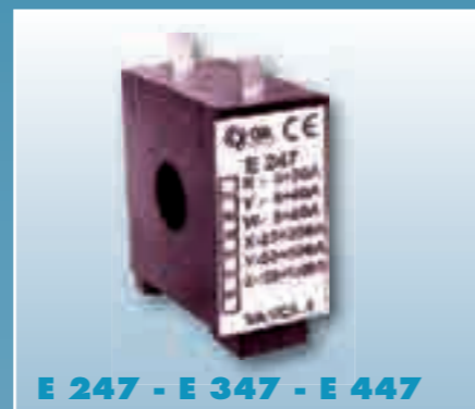
E 247 - E 347 - E 447

Dry run protection. Overload protection. Detection of eventual mechanical problems.